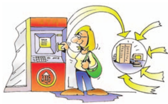
Εικόνα 15.2. Ανάληψη χρημάτων από τα μηχανήματα ATM

Στις Τράπεζες πίσω από τα μηχανήματα αυτόματης συναλλαγής (Αυτόματη Ταμειολογιστική Μηχανή, ATM) υπάρχουν υπολογιστές, που επικοινωνούν, για να αποφασίσουν πόσα χρήματα δικαιούμαστε να πάρουμε από την Τράπεζα (Εικόνα 15.2). Πριν από μερικά χρόνια αυτό φάνταζε σαν σενάριο επιστημονικής φαντασίας. Για να πάρει κάποιος χρήματα από την Τράπεζα, έπρεπε να περιμένει στην ουρά κατά το ωράριο λειτουργίας της τράπεζας. Σήμερα με τις κάρτες αυτόματης συναλλαγής (cash cards), που μας δίνουν τη δυνατότητα ανάληψης από τα μηχανήματα ATM όλο το 24ώρο, μπορούμε να κάνουμε τραπεζικές συναλλαγές μέσα σε λίγα λεπτά.