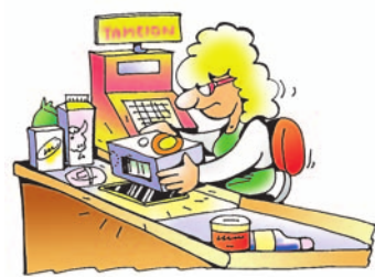
Εικόνα 15.1. Αυτόματη τιμολόγηση προϊόντων

Πολλές από τις καθημερινές μας δραστηριότητες υποστηρίζονται από τους υπολογιστές. Από το πρωί που θα ξυπνήσουμε μέχρι το τέλος της ημέρας συναντάμε αρκετά συχνά υπολογιστές, χωρίς πολλές φορές να το συνειδητοποιούμε. Πολλοί από τους υπολογιστές με τους οποίους ερχόμαστε σε επαφή, έχουν άλλη μορφή από αυτή των υπολογιστών του εργαστηρίου μας ή βρίσκονται μέσα σε άλλες συσκευές. Στα ταμεία των σουπερμάρκετ, για παράδειγμα, είναι ενσωματωμένος ένας υπολογιστής που υπολογίζει τι θα πληρώσουμε, ενώ ταυτόχρονα μπορεί να ενημερώνει τον καταστηματάρχη για το πόσα προϊόντα πουλήθηκαν (Εικόνα 15.1).